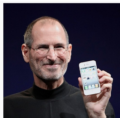
Steve Jobs présentant l'iPhone 4 lors du discours d'ouverture (keynote) de sa Présentation du 7 juin 2010.

Une bonne bouille de Gris, n'est-ce pas ? Sans parler de son réflexe alimentaire basé sur une alimentation qui contribue à une transformation du système digestif et une modification génétique orientant certains humains vers un futur entropique de Gris.