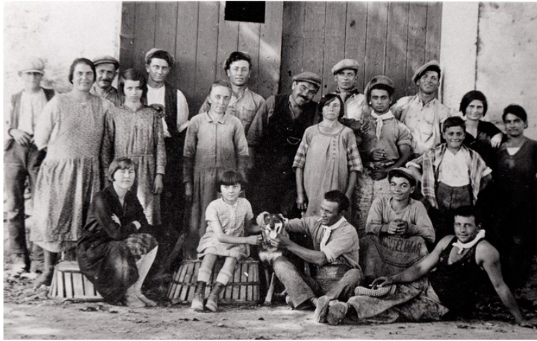
La lignée Ristori (étymologiquement "restaurer"). Génétique Sémite.

Évidemment, ce clivage entre ces deux origines se vérifie dans mon propre fonctionnement psychique. C'est du côté Ristori que me viennent mes facultés intuitives et émotionnelles, tandis que j'ai davantage hérité de contrôle, de capacités scientifiques et de mordant par le côté Rey-Herme (ma mère issue de cette lignée apportait d'ailleurs ses compétences en génétique pour sauvegarder des races d'ânes en voie d'extinction et par sa niaque, elle parvint à mener la barque de cette exploitation agricole marginale).