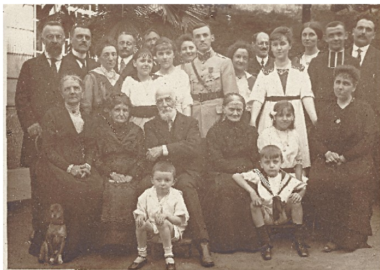
La lignée Rey-Herme (étymologiquement "roi-hermite"). Génétique aryenne.