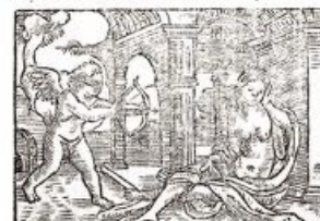
Comment feut baite & dotee labz baye des Thelemites. Chapitre. LI.

"Sul portone di Thelemem una scritta vieta l’entrata agli “ipocriti, bigotti, cagots” persone della giustizia e strozzini ; sono ammessi solo i “nobili cavalieri”, le “signore di alto lignaggio, fiori di bellezza, dal volto celeste, con un contegno puritano e saggio“. http://lechatsurmonepaule.over-blog.fr/2014/09/francois-rabelais-gargantua-l-abbaye-de-theleme.html